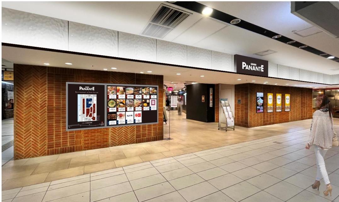
▲リニューアル後共用部イメージ（京阪電車 天満橋駅 西改札口側）